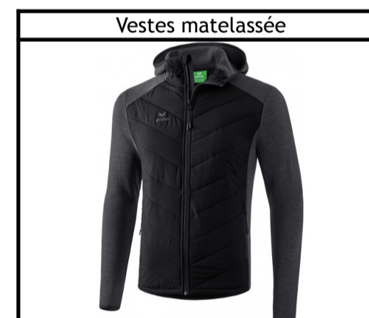
Taille : 128, 140, 152, 164, S, M, L, XL, XXL