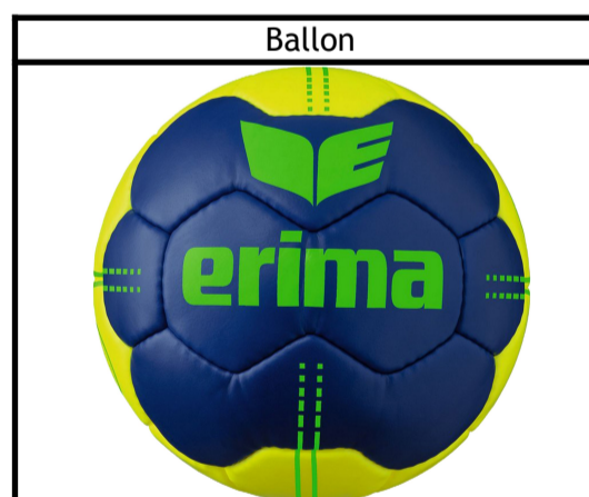
Taille : 0, 1, 2, 3