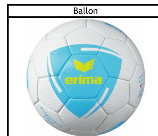
Taille : 00, 0