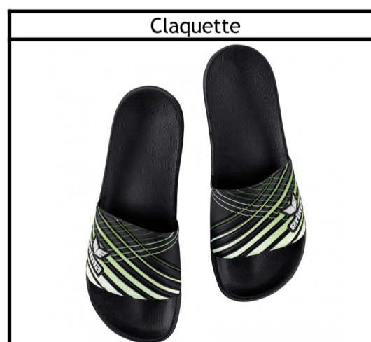
Taille : 36-47