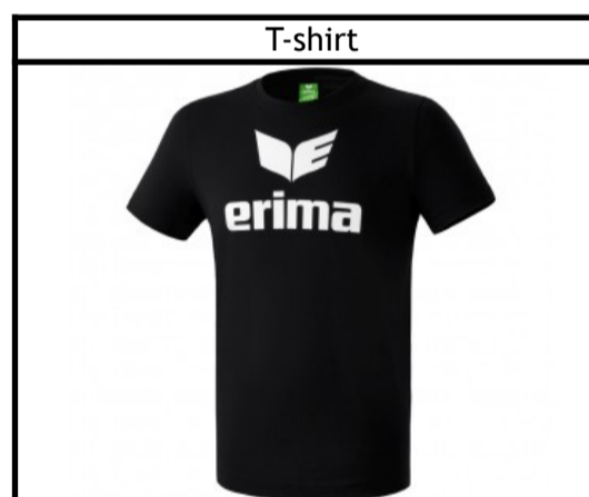
Taille : 116, 128, 140, 152, 164, S, M, L, XL, XXL