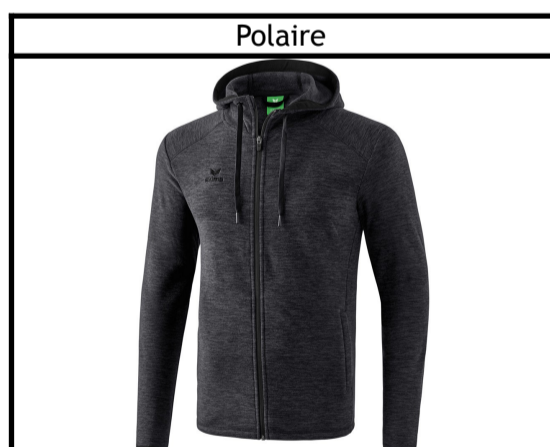
Taille : 128, 140, 152, 164, S, M, L, XL, XXL