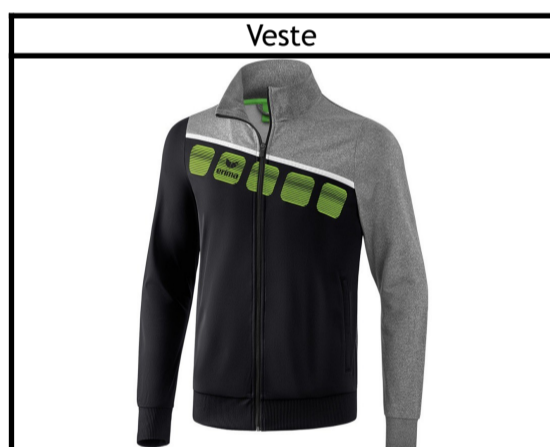
Taille : 116,128, 140, 152, 164, S, M, L, XL, XXL