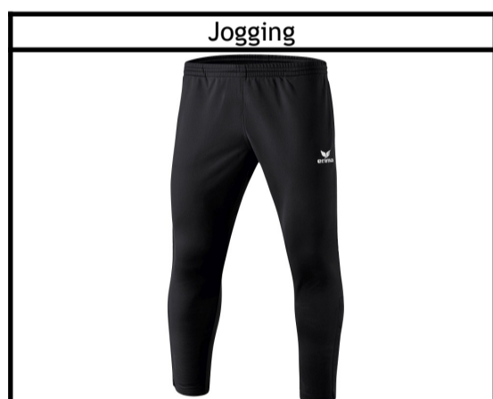
Taille : 116, 128, 140, 152, 164, S, M, L, XL, XXL